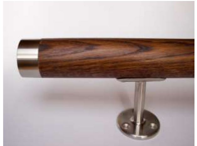
Eiche dunkel gebeizt und geölt mit Hartwachsöl

Vollmassiv bis ca. 4 m (nicht keilverzinkt und nicht geschäftet) roh, fein geschliffen