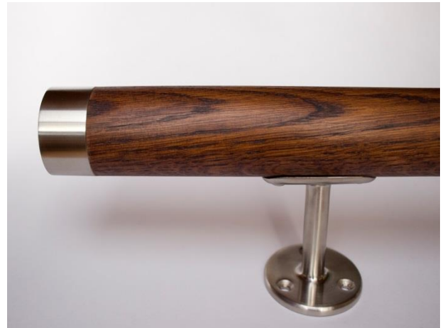
Eiche dunkel gebeizt und geölt mit Hartwachsöl

Vollmassiv bis ca. 4 m (nicht keilverzinkt und nicht geschäftet) roh, fein geschliffen